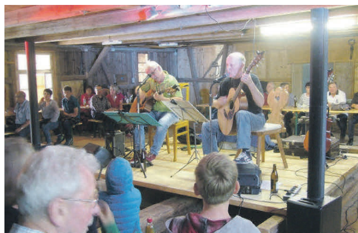
Konzert mit After Midnight

Bei schönem Wetter hinter der Sägmühle im Freien, ansonsten in der Sägmühle