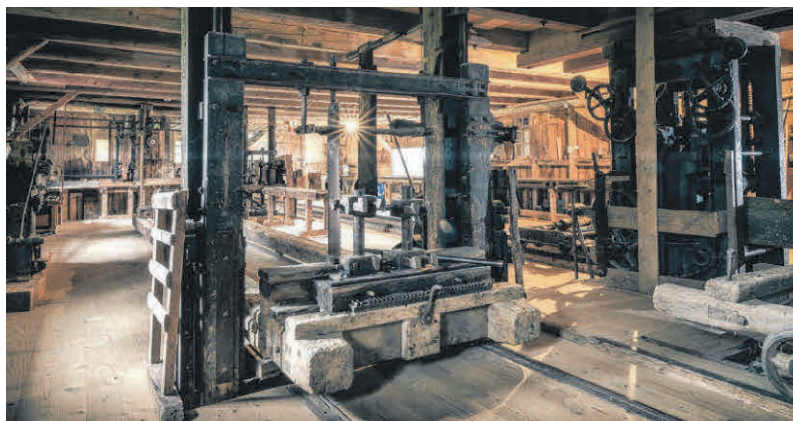
In der Sägmühle

Bei schönem Wetter lädt der Garten hinter der Säge zum Verweilen ein.